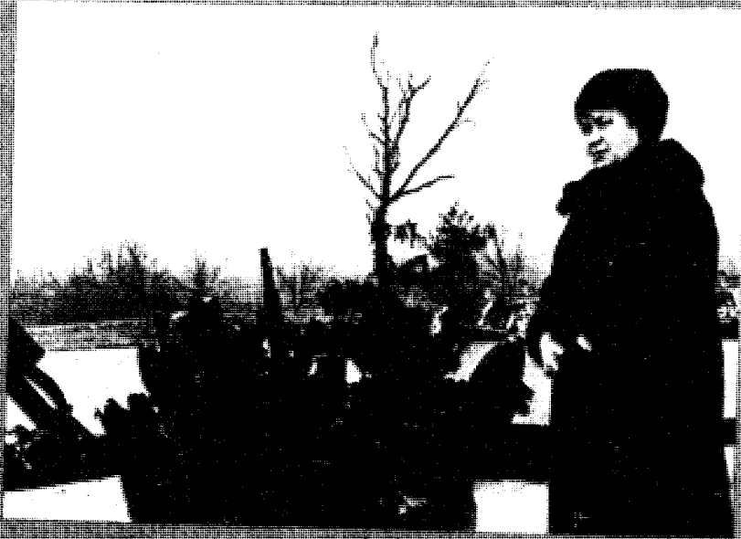
Возвращение домой Не отдала в Сортуле

Воспитан. Спасской школы А. Векунцов - Н. Добрынина в Будапеште У родного дома в поселке Бекетово