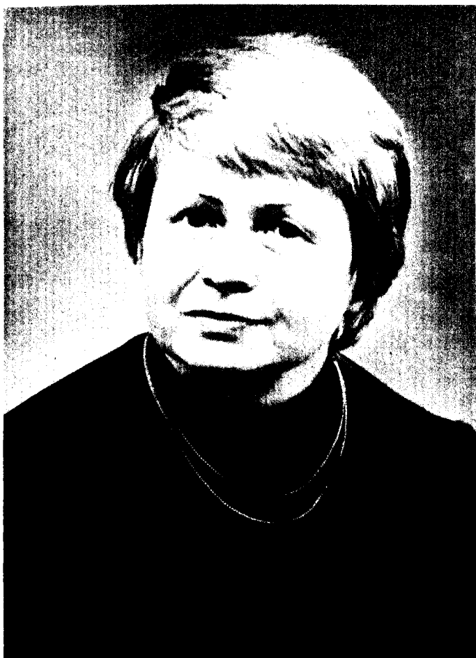
АЛЕКСАНДРА НИКОЛАЕВНА ПАХМУТОВА

Вначале было детство... Признание, успех, награды, звания, грампластинки «Гигант» и, наконец, «Золотой диск» — за огромные тиражи с записями ее песен — все пришло потом.