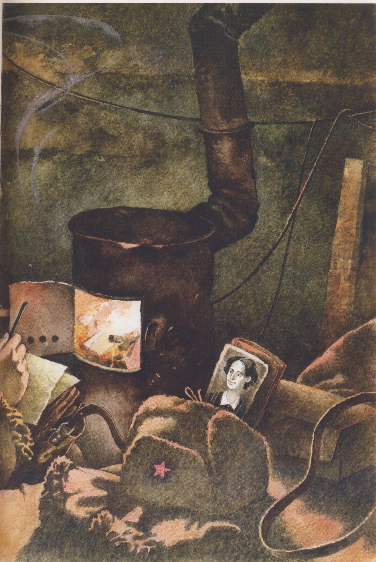
Картина к беседе «Музыка войны»