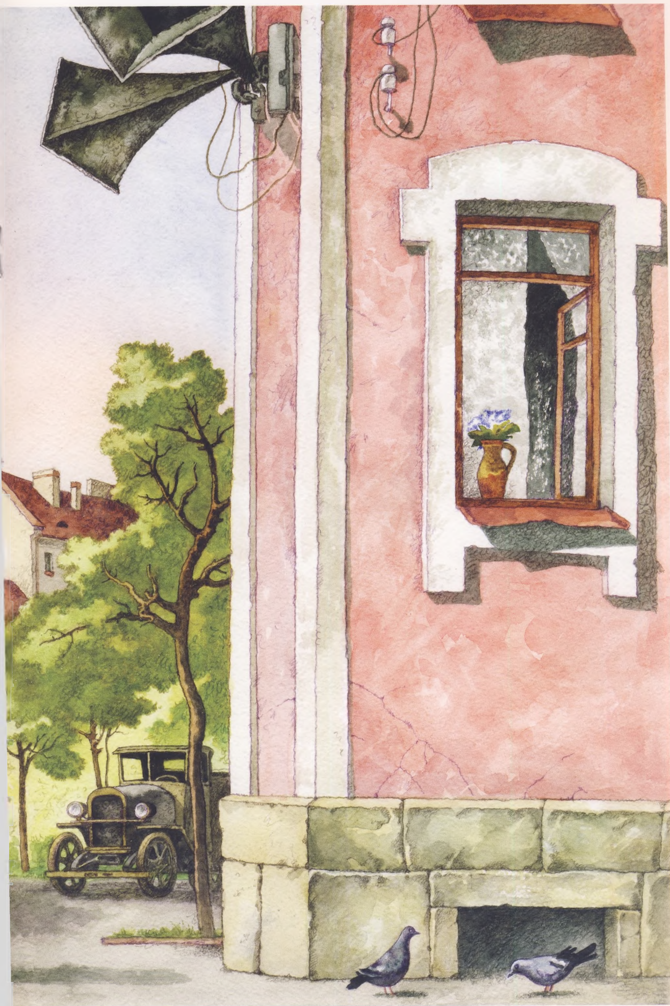
Картина к беседе «Родина-мать зовет!»