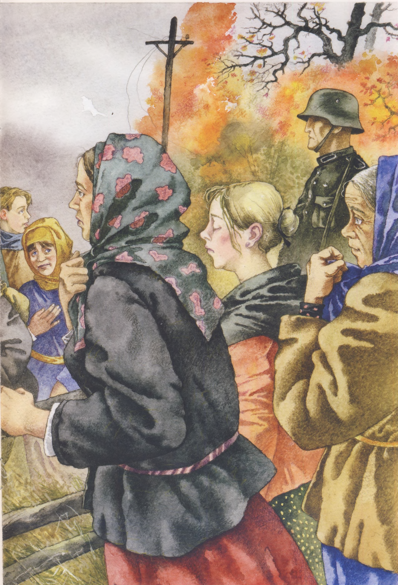
Картина к беседе «Дети войны»