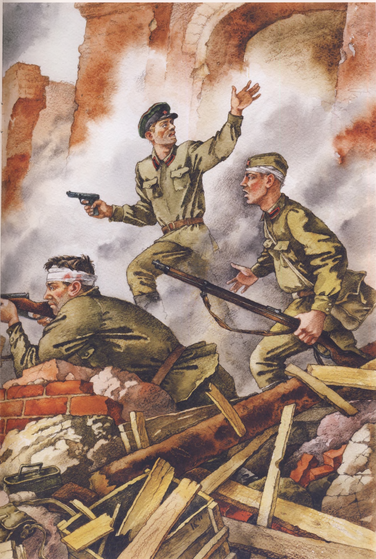
Картина к беседе «Великие битвы»